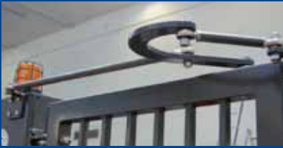
Bras de transmission