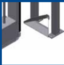
détail butée d'arrêt