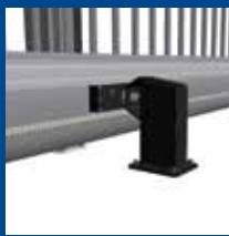
détail roues de guidage poutre de soubassement