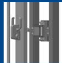
détail fermeture sur poteau de réception